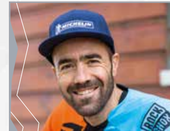
Nicolas Vouilloz Rekord-Weltmeister im Downhill

Nicolas hat immer wieder Grenzen überschritten. Nicht umsonst wird er ET genannt. Rekordweltmeister, dann erfolgreicher Rallye-Fahrer und nun eine beeindruckende Karriere im Enduro-Segment. Das eMountainbike ist für ihn Trainingsgerät und Spaßbringer zugleich.